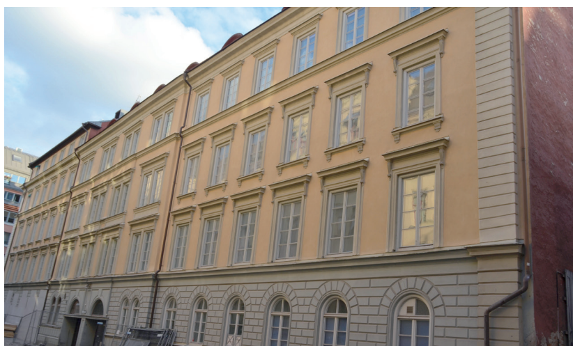
Idag. Stockholms sista hyreshuspalats i originalskick från 1873