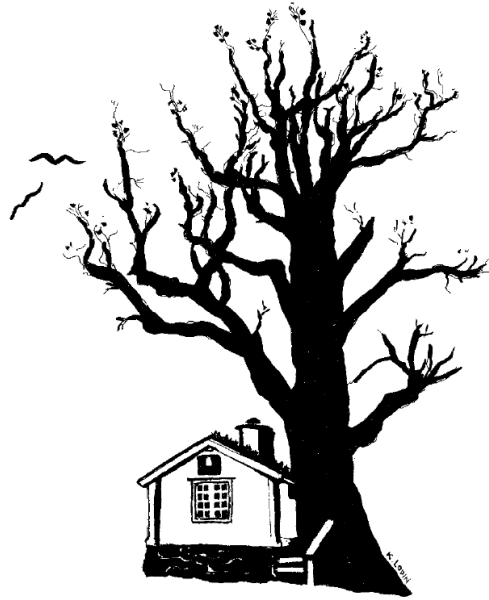
Konung Carl XI:s Fiskarstuga